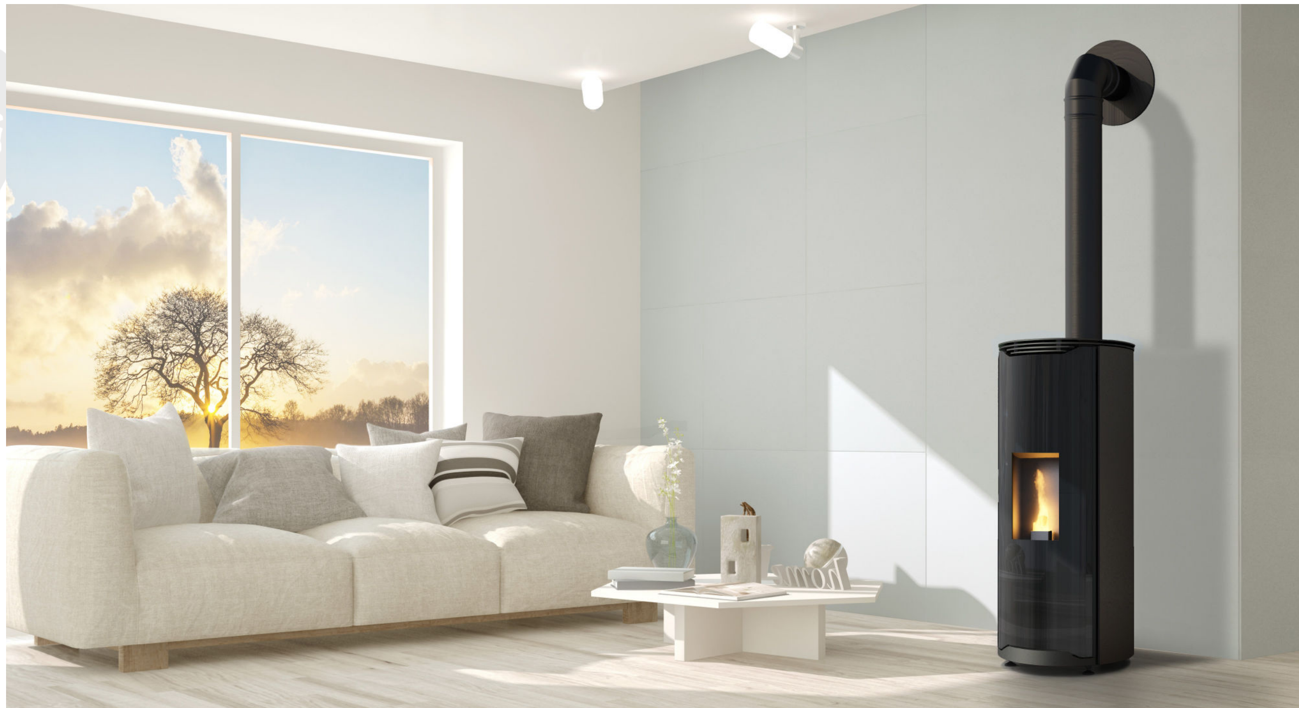
VERLAINE / 8kW ETANCHE / HABILLAGE ACIER NOIR / PORTE EN VERRE / TOP COULISSANT