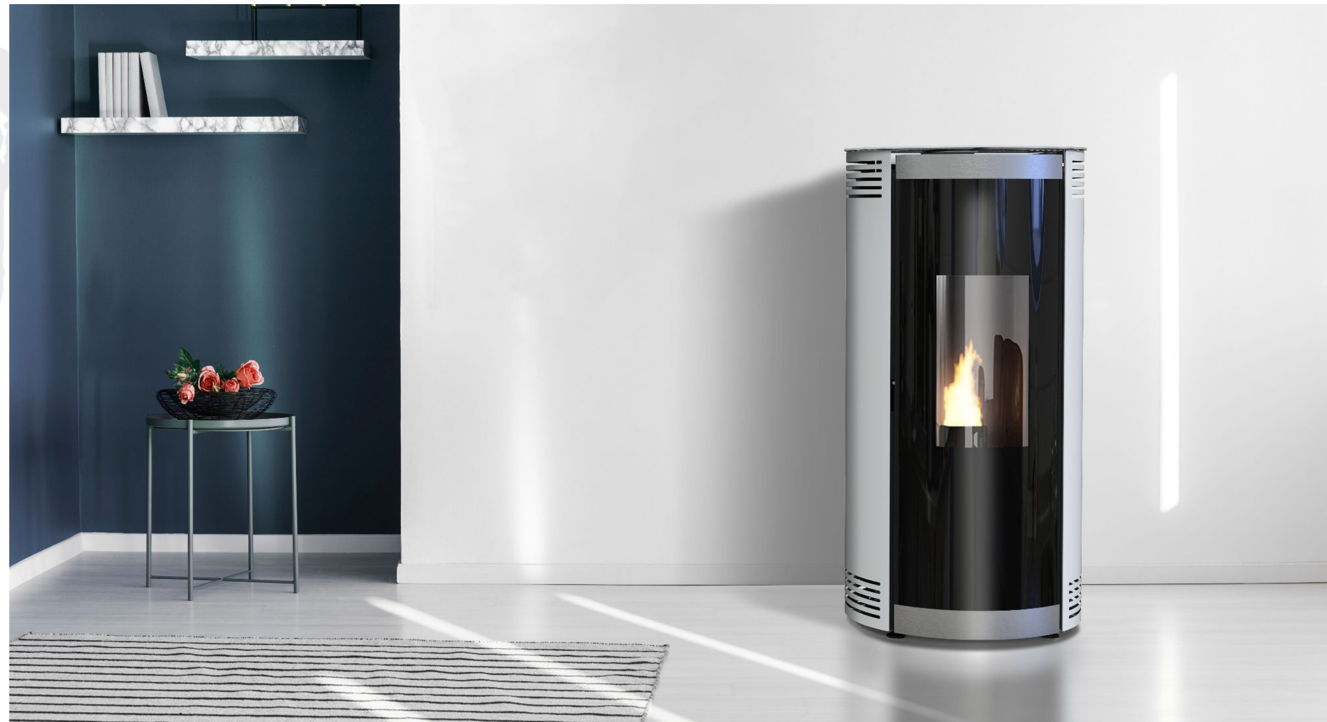
TODRA / 11.5kW air+ ETANCHE / HABILLAGE ACIER GRIS CLAIR / PORTE EN VERRE