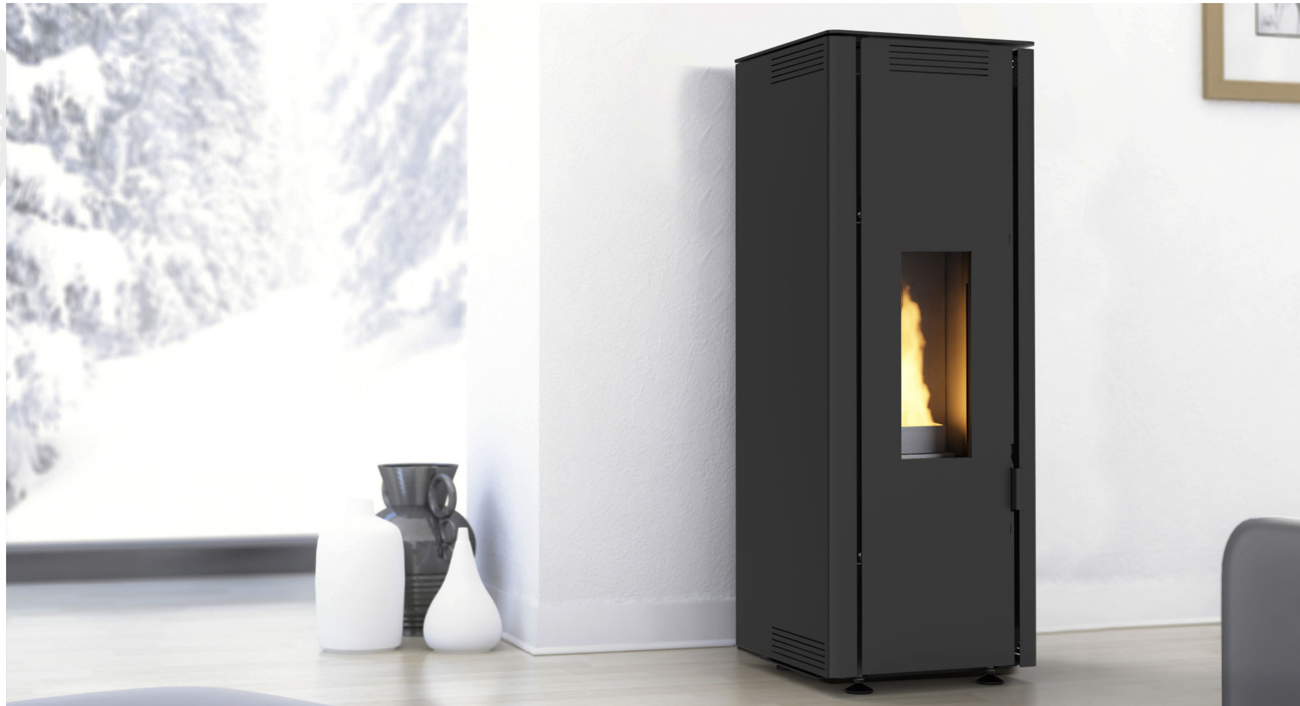
STEEL / 6.5kW ETANCHE / HABILLAGE EN ACIER NOIR