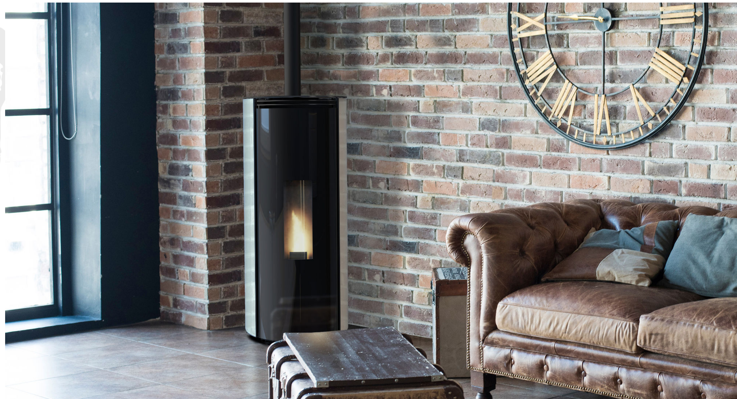
RIMBAUD GLASS / 6.5KW ETANCHE / HABILLAGE EN VERRE BLANC / PORTE EN VERRE / TOP EN ACIER