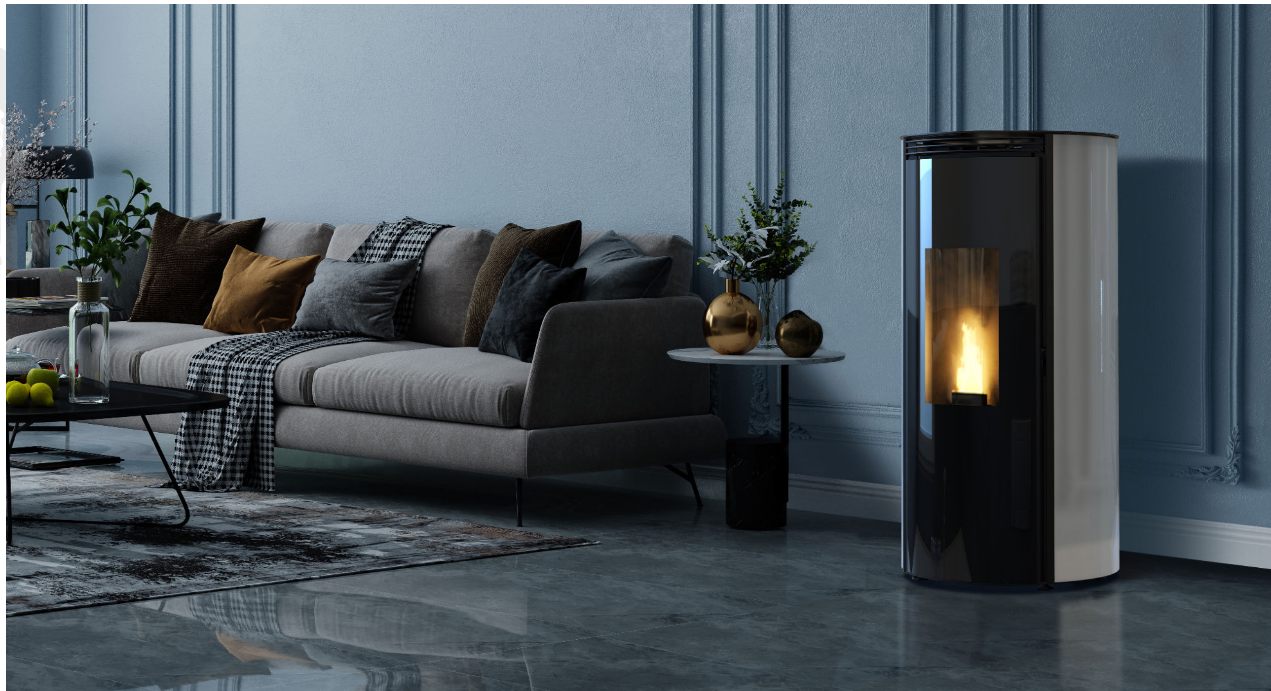
MAUNA GLASS / 11.5kW air+ ETANCHE / HABILLAGE EN VERRE BLANC / PORTE EN VERRE / TOP EN ACIER NOIR